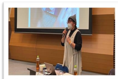
過去の講座の様子